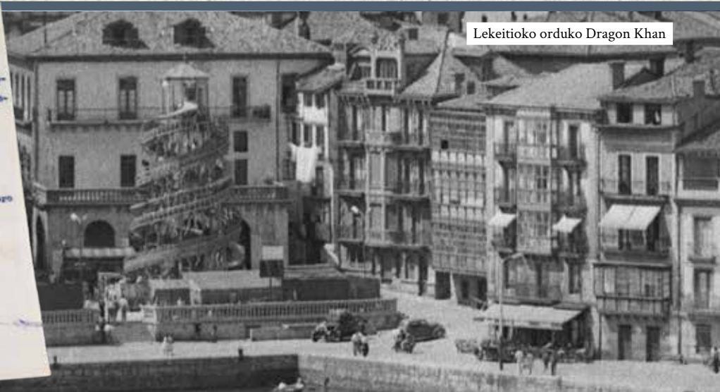
Lekeitioko orduko Dragon Khan