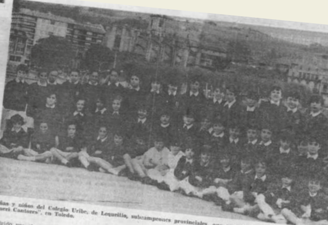
Niñas y niños del Colegio Uribe, de Lekeitio, subcampeones provinciales, que participarán en el Congreso Internacional "Pueri Cantores", en Toledo.

LEQUEITIO: UN CORO ESCOLAR INVITADO AL CONGRESO INTERNACIONAL DE NIÑOS CANTORES