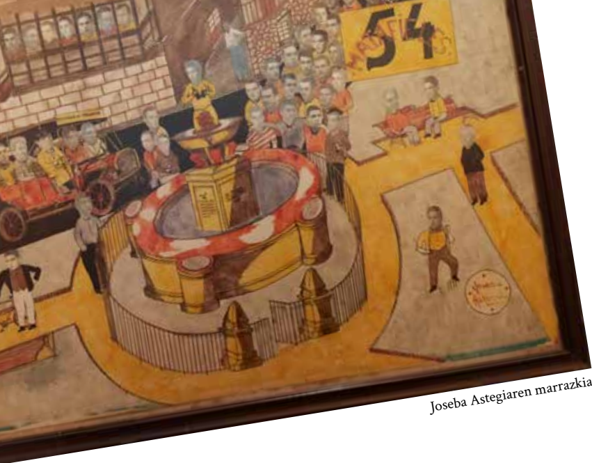
Joseba Astegiaren marrazkia