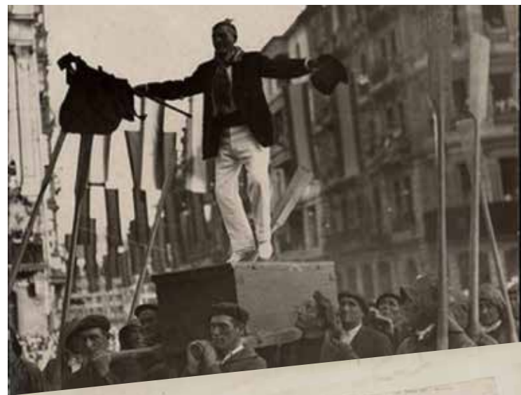
Kaxarranka Bilbon, 1938-10-1

No comment! (Ipar) Amerikarrek dena bihurtzen dute espektakulu!