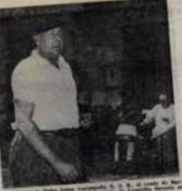
Don Juan de Borbón y Battenberg Lekeitio, 1965-8-27

A la cabeza de la comitiva que se dirige a Lekeitio para celebrar el centenario de la fundación de la Banda Municipal, el conde de Barcelona, don Juan de Borbón y Battenberg, acompañado de su esposa, la condesa María de las Mercedes, y de sus hijos, don Juan Carlos y doña Sofía, se despidió ayer de la ciudad de Lekeitio tras haber disfrutado de un día de estancia en esta localidad. El conde y su familia se embarcaron en el ferrocarril para dirigirse a San Sebastián, donde permanecerán hasta el día de mañana, cuando partirán hacia Madrid.