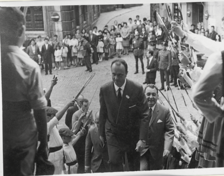
Fraga Iribarne ministra Lekeitio, 1968-5-5