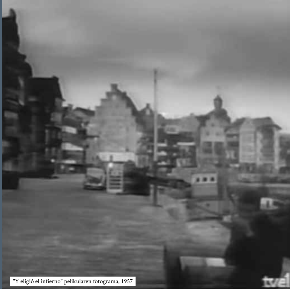
"Y eligió el infierno" pelikularen fotograma, 1957