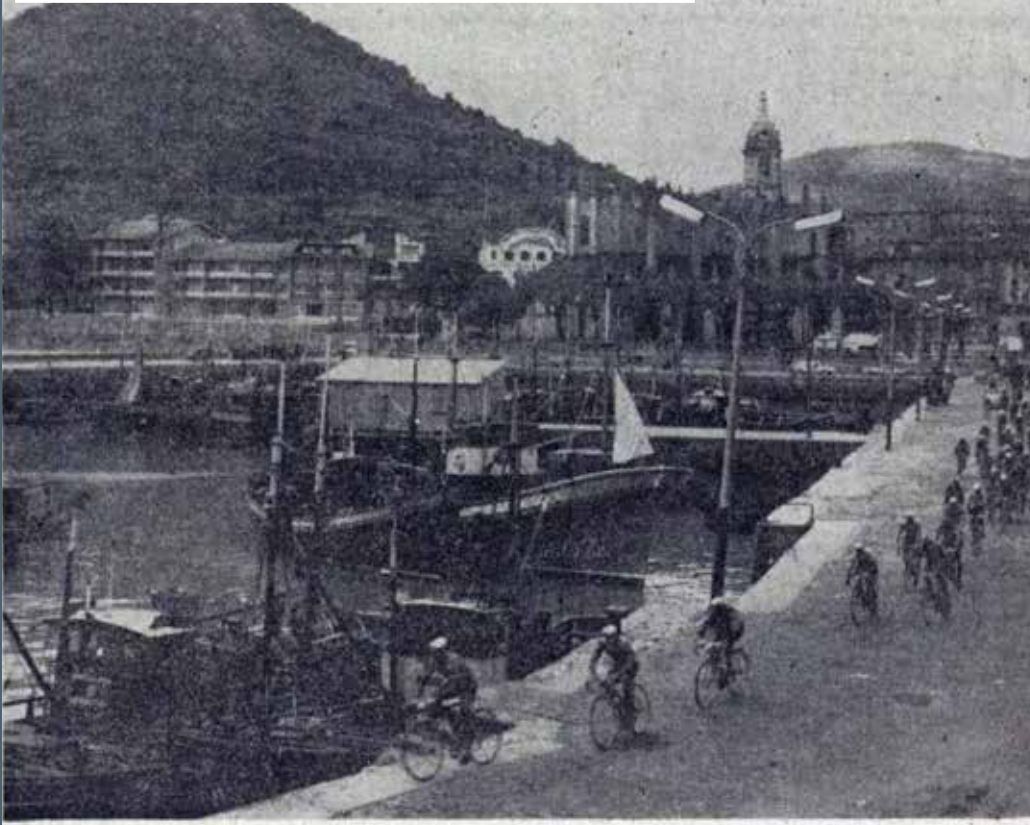
AYGOES, nuestro fotógrafo, enviado especial a la Vuelta 62, inauguró ayer una extraordinaria Exposición de sus Club Deportivo, que puede visitarse libremente por todos cuantos quieran admirar las más bellas escenas de la ronda. En ellas, el paisaje juega un especial papel de protagonista. Y por eso no nos resistimos a reproducir hoy en nuestra deportiva esta magnífica estampa de LEKEITIO, donde los ciclistas tuvieron, con la misma perfecta organización, de Avituallamiento. Por ello nuevamente Lekeitio ofreció al fotógrafo AYGOES la posibilidad de lograr esta magnífica estampa turístico-deportiva. En el Club Deportivo pueden ver y admirar muchas más...