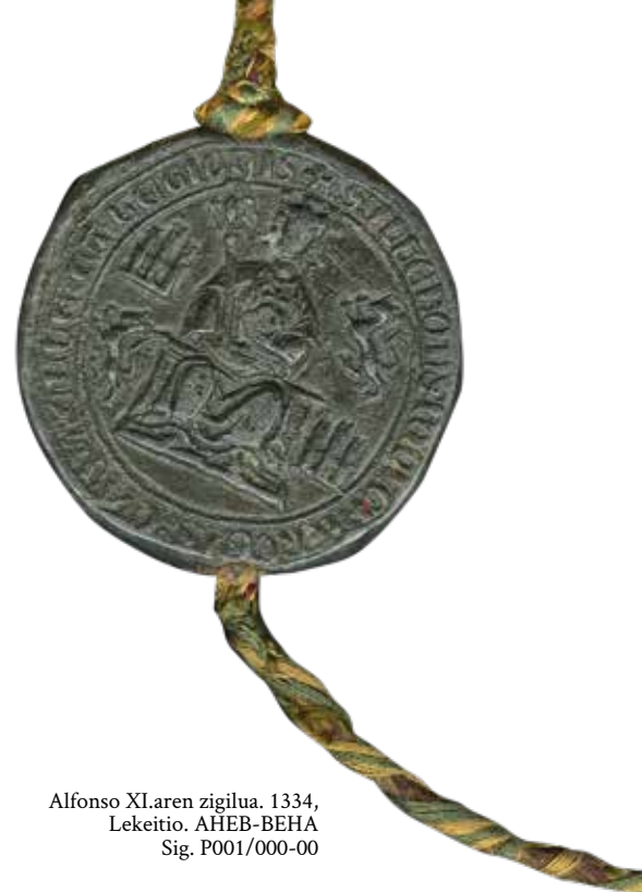
Alfonso XI.aren zigilua. 1334, Lekeitio. AHEB-BEHA Sig. P001/000-00

bildo Eklesiastikoaren auziekin lotuak, onuren-gatik edo Kurian edo Erregean jatorria duten hamarregatik. 5 Pergamino musikalak, antifonario eta kyrialeko atalak (XVI-XVII. mendeak) eta hitzaldi liturgiko moralen eta euskarako sermoien sorta interesgarri bat (1782-1840). Hala, parrokiak funtzionatzen eta bere jarduera gauzatzen jarraitzen zuen heinean, dokumentazioa sortuz joan zen. Bere parrokia-artxiboa bizia eta dinamikoa da, eta AHEB-BEHAn eskualdatzen jarraituko du, non jada gordeta dauden funtsen deskribapenean eta hedapenean sakontzen ari garen.