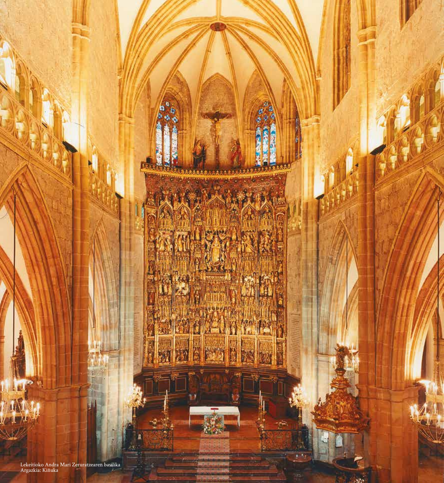
Lekeitioko Andra Mari Zeruratzearen basilika