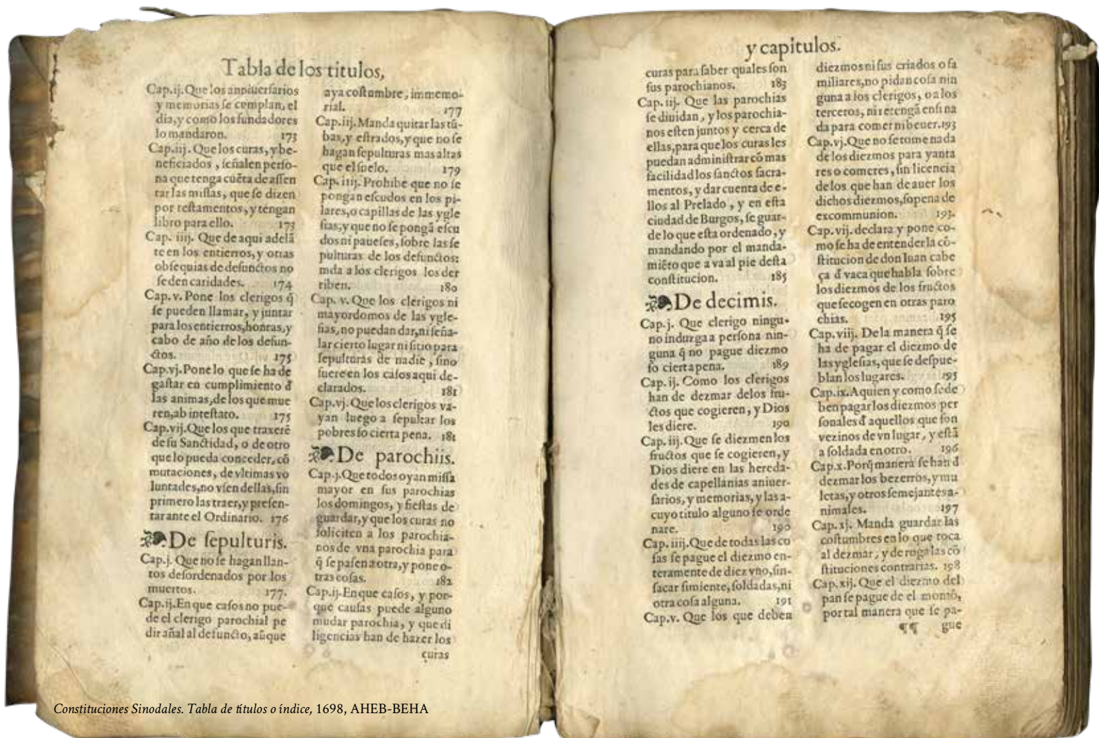
Constituciones Sinodales. Tabla de títulos o índice, 1698, AHEB-BEHA