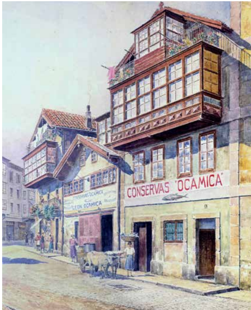
Okamikaren kontserba fabrika