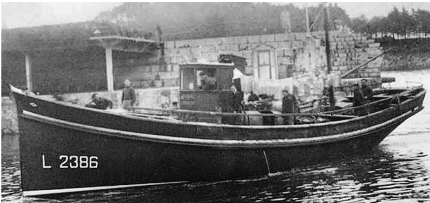
Aita Guria arrantzontzia

tzuk topau genduzan, txikiagoak; guk balandruak esaten eutsegun, ze belan ibiltzen ziran arrainetan, kazan. Gaua ailegau zanean jitoan geratu ginan eurekin batera. Gure barruko gizonak euren barriketaldian ebiltzan, ia beti lez. Ni ezin neitekean hareekana ezta hurreratu be, autuan ebiltzanean, ze artean ez nintzan "gizona", "mutiltxikiña" baino.