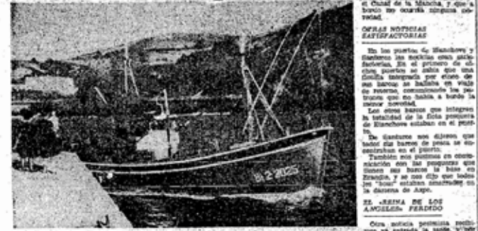
A este ya del temporal, uno de los pesqueros bermeanos parece desmenuzarse en la dársena de Arca.