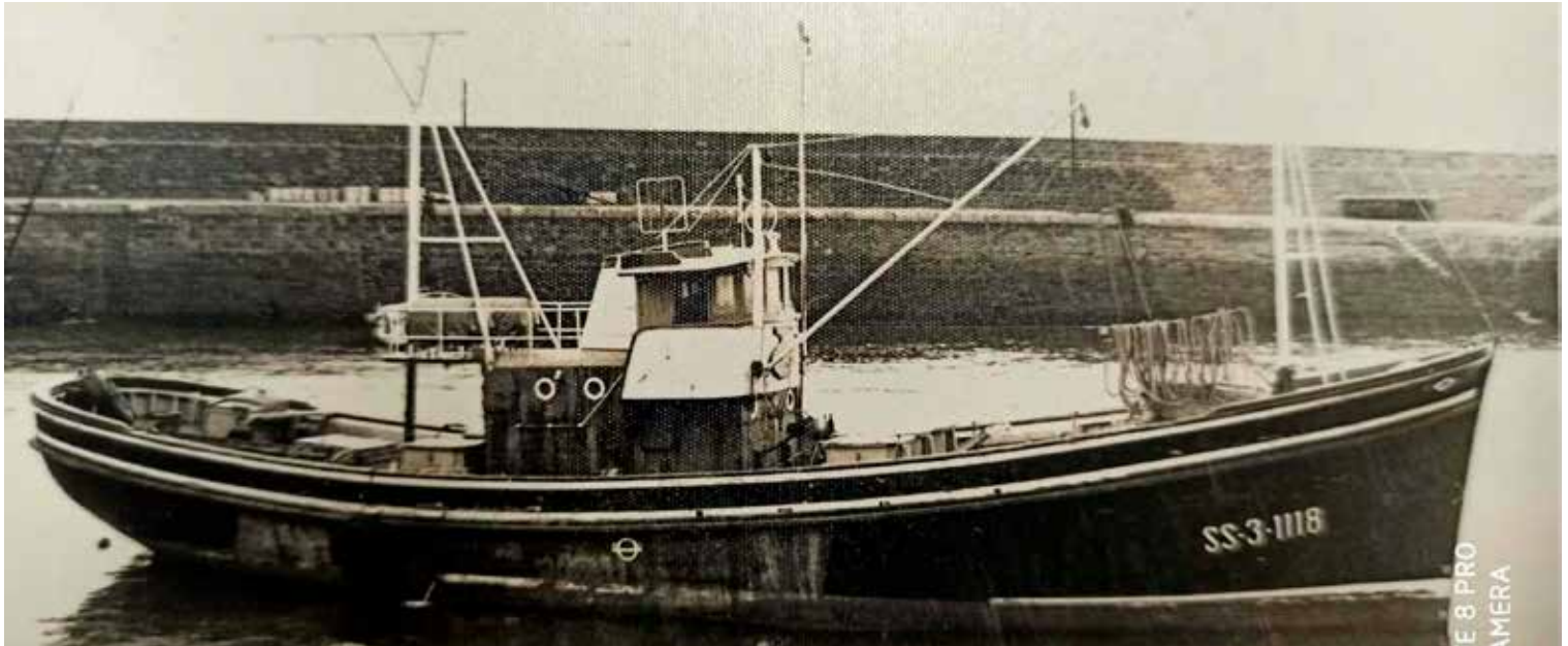
Mater Dolorosa arrantzontzia

Orduan denporan gurea lako baportxoak ez egoazan prestatuta eguraldi zantarra zanetan Frantzia mendebaldeko portuetara heltzeko. Hango urak, kostatik hurre, dzingo txikikoak dira eta bertako portuetara sartzeko, ubide estu samarretan zehar egiten da, eta, ekatxa danean, ubide horreetatik kanpo hatxetan lez lehertzen da itsasoa. Ez geunkan mapa nautikorik, ez beste bitartekorik, non gengoan kokatzeko, ezta halakoak erabiltzeko eza-gutzarik be. Hemen buruko zinematikak ez eukan baliorik, ez geunkan ezta irrati bat be laguntasuna eskatzeko. Bildurra besterik ez geunkan.