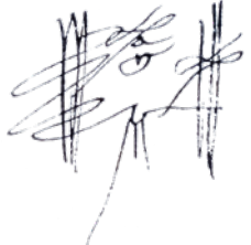
Garcia de Crisal maisuaren sinadura, 1511 aldean

+ inf. www.retablosdebizkaia.com/lekeitio