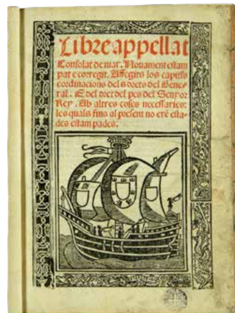
Código de las costumbres marítimas, o Libro de Consulado, 1518. Barcelona (Carlos Amorós)

las poleas grandes y chicas de la nao que el capitán Arteita tiene en el astillero de la dicha villa, y entregar el trabajo para las siguientes Carnestolendas por 8 ducados de oro, de los que ha recibido 4 por adelantado 194 .