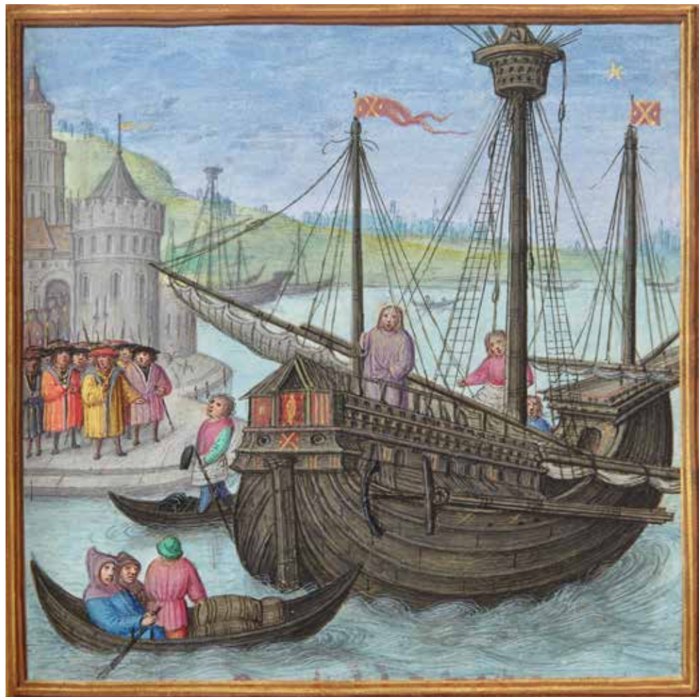
Llegada de Carlos V a Gante en 1520. Libro de Oficios de Salomón, Gante, 1520. Biblioteca del Monasterio del Escorial. Sig. 139-IV-96

En septiembre del 1519, el rey Carlos encarga a Fonseca la formación en La Coruña de una gruesa armada para llevarlo a Flandes desde donde acudirá a tierras del imperio para ser coronado emperador. Fonseca otorga poder al capitán Arteita el 5 de noviembre siguiente para retener las embarcaciones que considere necesarias para la armada, tomar fianzas a sus maestros de que de tornaviaje se presentarán donde se les mande y dotarlas de los bastimentos, pertrechos, aparejos y marinería que puedan necesitar, pagando por todo ello su justo valor. En virtud de este poder, Arteita embarga las naos cargadas de lana para Flandes surtas en la ribera de Portugaleta y ordena al alcalde