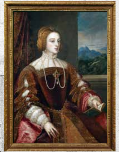
Isabel de Portugal

M o . del Rey y de Aragón y de Sicilia y de Navarra