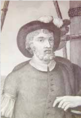
Juan Sebastián Elcano