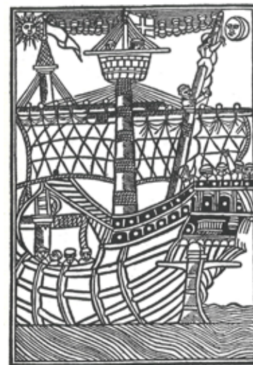
Portada del libro del Consulado del Mar, 1502. Barcelona