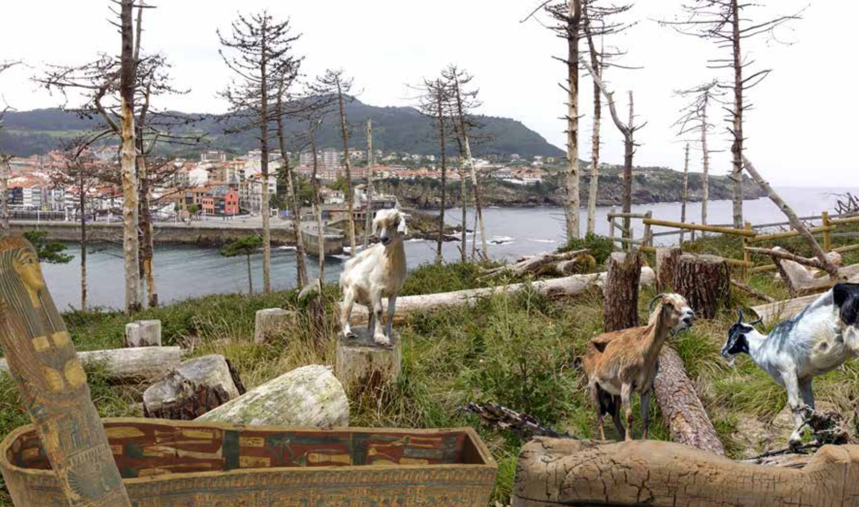
Fotomuntaketa. Akerrak ez dira Okabijonak (eta akerrak be ez diraz).