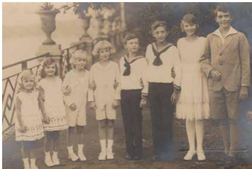
Familia inperiala Uribarren jauregiko parkean