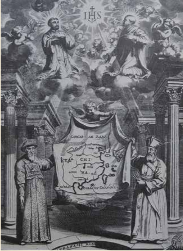
"China illustrata", Athanese Kirchere, 1667