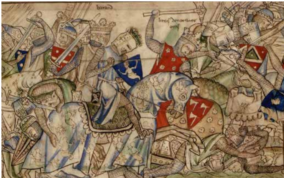
"The life of King Edward the Confessor", 32 v. Matthew Paris, 1250-60. Cambridge University Library