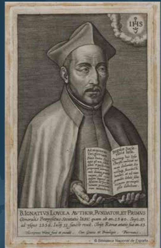
San Iñazio Loiolakoa