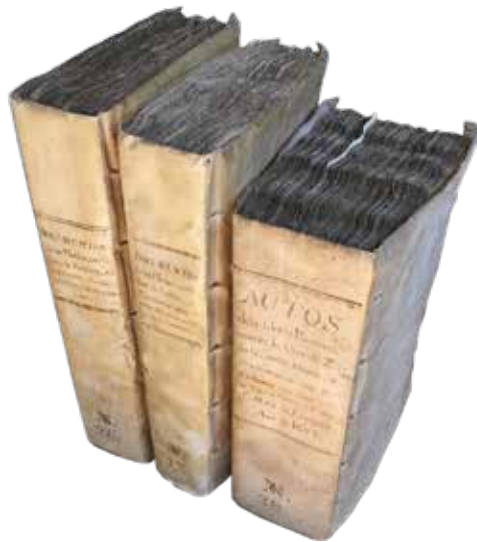
Lekeitio eta Yarzararren arteko liskarrak eta auzi amai-gabeak. LUA R26, 27, 28

berriro aurre egiten zien nobleei. Yarzararrak eta Lekeitio eten gabeko auzietan sartuta bizi ziren urteak etorri eta urteak joan, mendeak etorri eta mendeak joan.