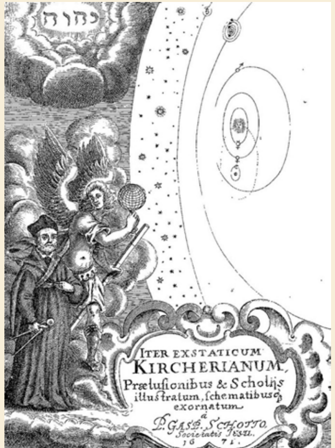
"Iter Exstaticum", Athanasius Kircher, 1660