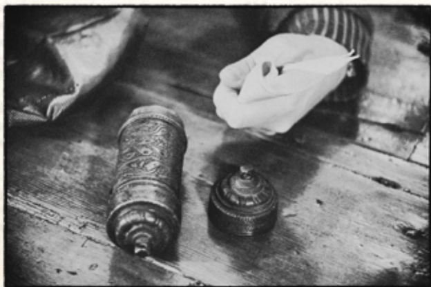
Hildakoaren alboan aurkitutako tutu metalikoa.