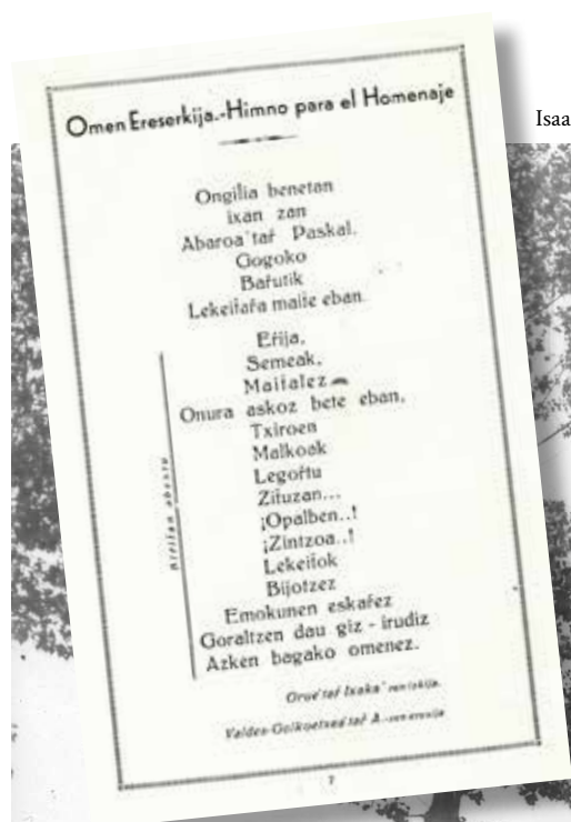
Isaac Oruek Paskal Abaroari eskeinitako bertsoak