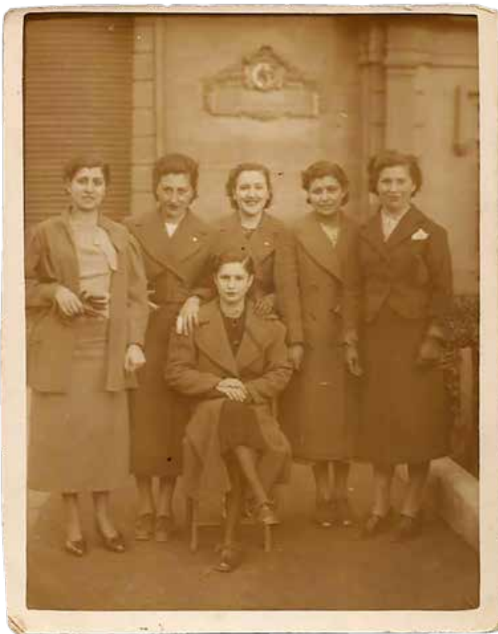
Bartzelona, 1938-12-10