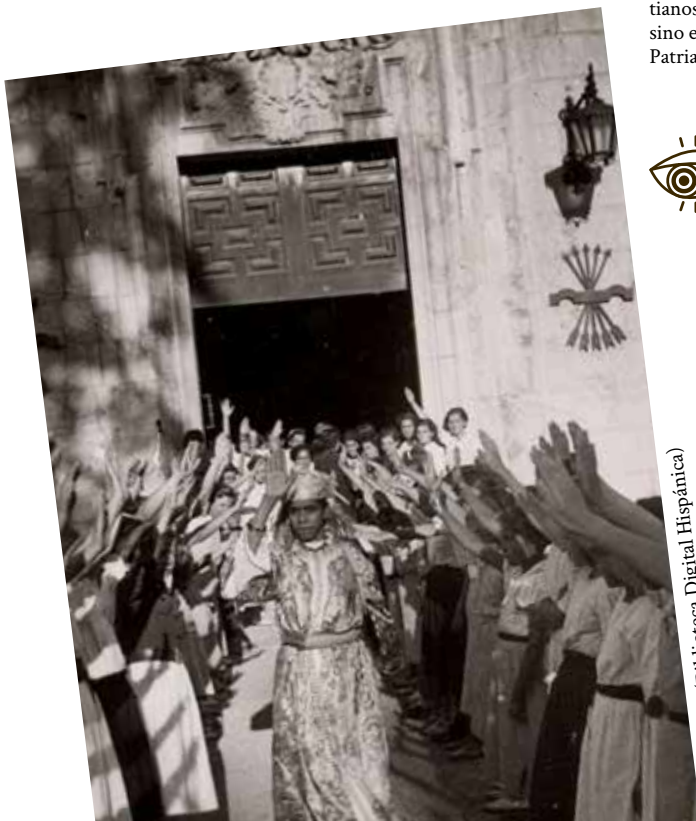
Y aldizkaria, 1938-9-1