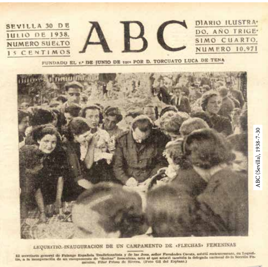
LEQUEITIO. INAUGURACION DE UN CAMPAMENTO DE «FLECHAS» FEMENINAS

El secretario general de Falange Española Tradicionalista y de las JONS, señor Fernández Cuesta, asistió recientemente, en Lequeitio, a la inauguración de un campamento de «flechas» femeninas, acto al que asistió también la delegada nacional de la Sección Femenina, Pilar Primo de Rivera.