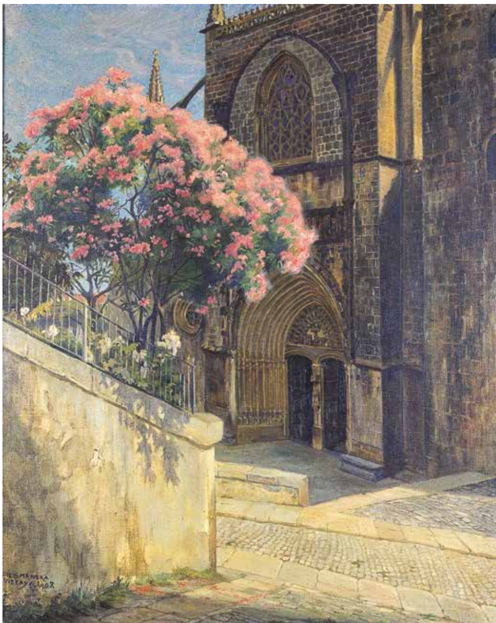
4 - Iglesia de Lekeitio edo Piedra vieja y flores nuevas, Diego Rivera, 1907

gusiena margolan honetan— nabarmentzen du, orban kromatikoek eta argi-ilunek areagotua dena, eta horrexegatik kubismoaren ait-zindari gisa eta Riverak XIX. mendeko loturak uzten dituen lehen lana kontsideratu izan da. 7