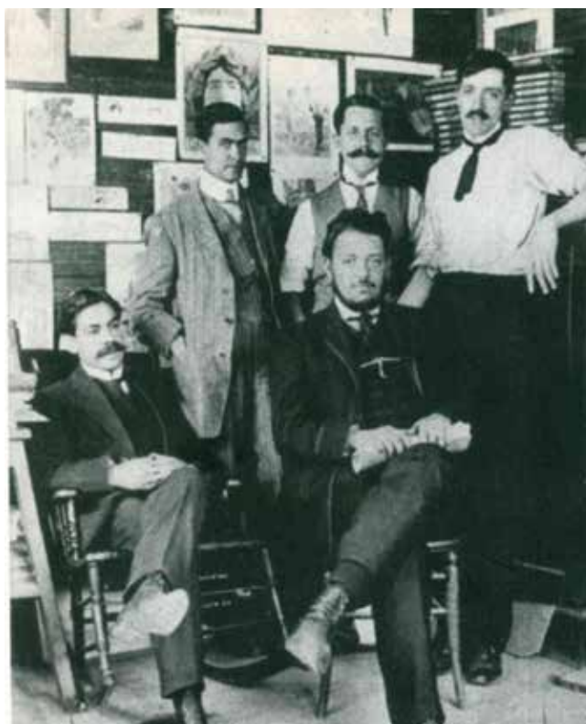
1 – Diego Rivera bere ikaskideekin Arte Ederren Eskola Nazionalean. 1906

Diego Riverak 1907 eta 1909 artean Espainian bizitako garaia madurazio akademikoarena eta Parisen abangardia ezagutzeak ekarriko zion akademizismoaren superazioaren aurrerapena izan zen, eta bi urte horietan zuzenean Chicharroren eta Madrileko giroan