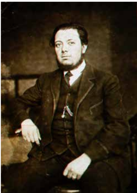
12 - Diego Rivera. ca. 1910-11