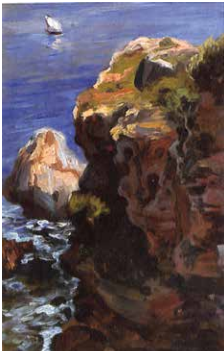
10 - Costa cantábrica , Diego Rivera, ca. 1907