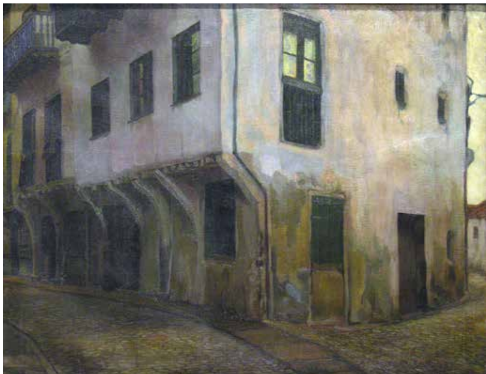
3 - La Casona , Diego Rivera, 1907

La Casona [3. fig.] izeneko lanak Behoko eta Tortola kaleen arteko eskina egiten duten etxeak errepresentatzen ditu, lekuaren testigantza errealista baino gehiago aitzakia plastiko gisa, Lekeitio osatutako pintura modernoengan. Rivera bi kalekura kurbatuen kontraposizioaz eta bereziki eraikinaren ardatz bertikal eta horizontal ezberdinez baliatzen da, etxeek mihise ia osoa okupatzen duten konposizio konplexu bat osatzeko, zeru irekiari eskuma aldean soilik irtenune estu bat libre utziz. Ikuspuntu hain hurbilak, kalearen angeluetako batean, etxebizitzaren monumentaltasun eta bolumentria sentsazioa –artistaren interes na-