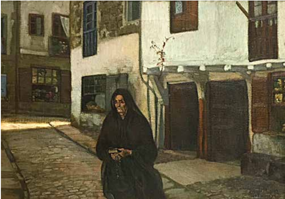
8 - Izenbururik gabe , Diego Rivera, 1907