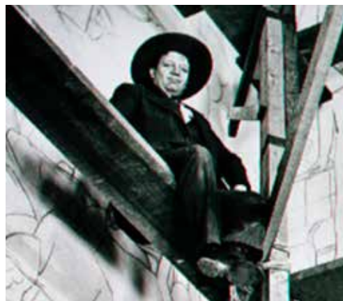
13 - Diego Rivera aldamio batera igota

tzuetan misterio eta nostalgia atmosfera berezi bat eta bolumenen tratamendu interesgarri bat lortzen duen, hurrenez-hurren–, Lekeitioan osatu eta egun kontserbatzen diren mihiseetako batzuk, La Casona edo La parte de Pedro kasu, Europara lehen aldiz iritsi eta oraindik abangoardiarekin bat egin aurretik 1907 eta 1909 arteko Riveraren pieza esanguratsuenen artean kokatu behar dira. Formazio akademikoko artista gaztea teknikaren domeinurantzko prozesu batean aurkitzen da, artista moderno espainiarrengan nagusi diren nobedade plastikoak ezagutu eta horiekin modu lotsatian esperimentatuz [12. fig.]. Kale eszenak eta paisaia naturalak errepresentatzen dituzten kontraste luminiko eta kromatiko esanguratsuko izaera errealistako pinturak dira, marrazkiaren erabilera zuzen eta bolumenen eta kolorearen aplikazioan nolabaiteko ausardiarekin, kostunbrismo lokalarekiko hurbiltasun bat ere atzeman daitekeelarik.