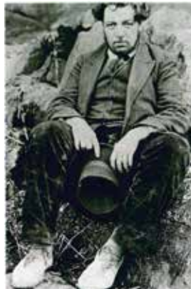
2 - Diego Rivera Angelina Beloff-ek erretratatu. 1909

Ez dira ezagutzen Lekeitiora bidaiatzearen arrazoiak eta bertan eman ahal izan zuen denbora. Zubiaurre anaiak, Aurelio Arteta edo Julian Tellache bezalako euskal artista ezberdinekin adiskidetasuna egin zuela esan izan da. 6