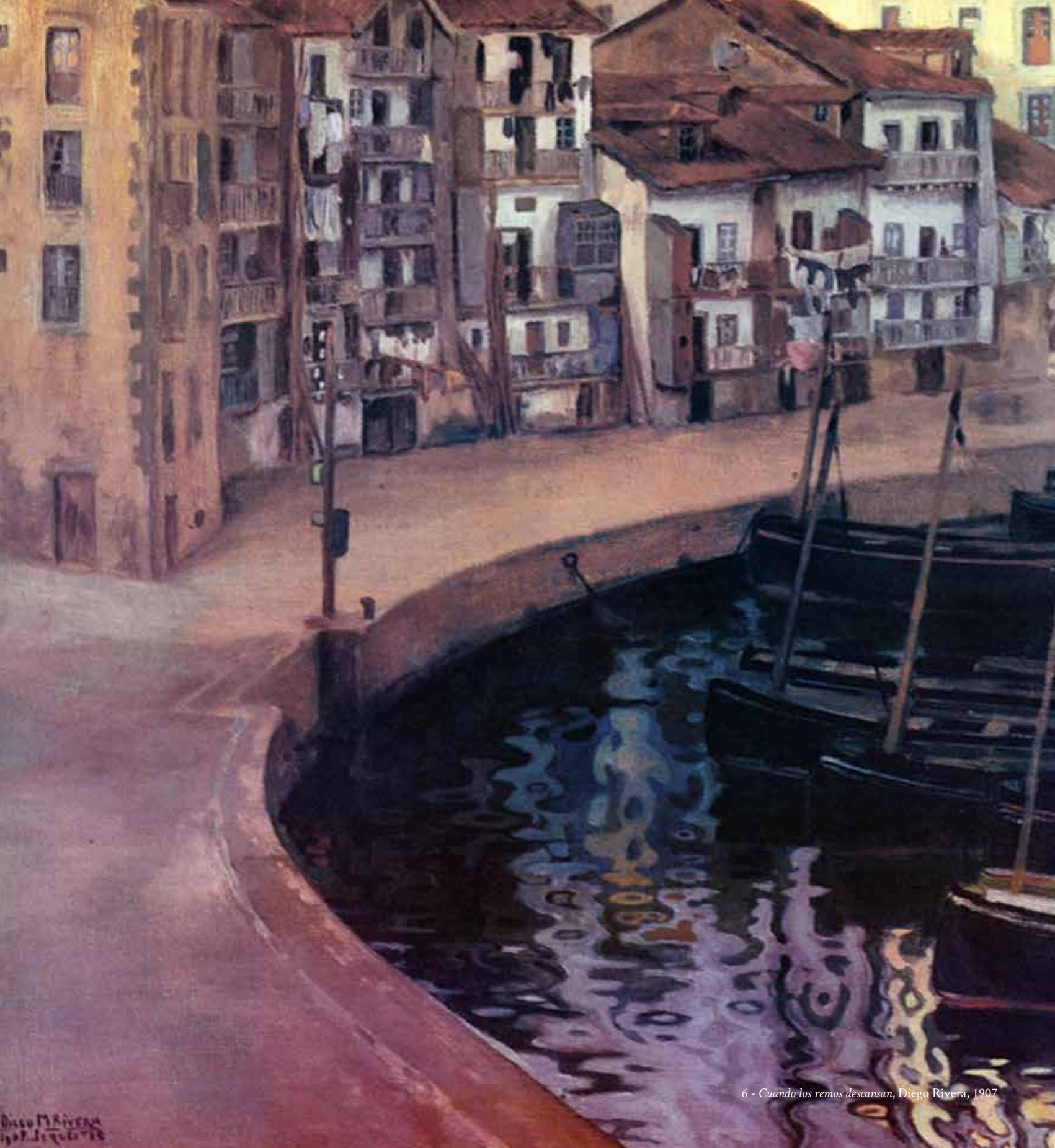
6 - Cuando los remos descansan, Diego Rivera, 1907