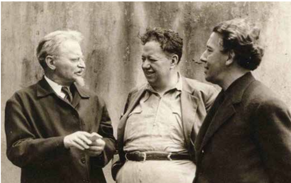
15 - Leon Trotsky, Diego Rivera eta André Breton. 1938