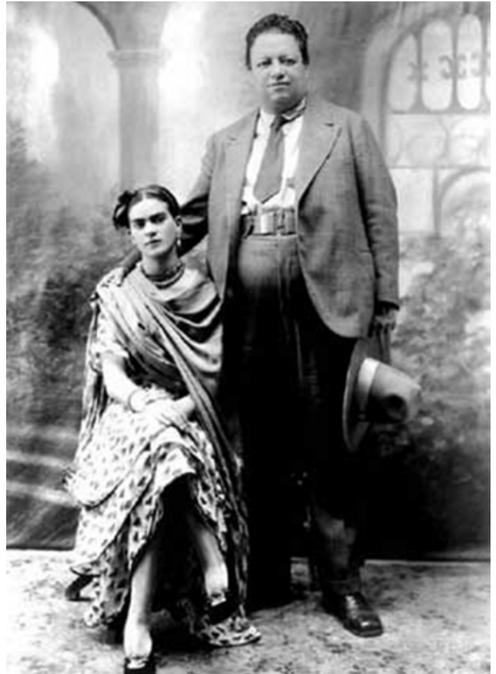
14- Frida Kahlo eta Diego Rivera. ca. 1929